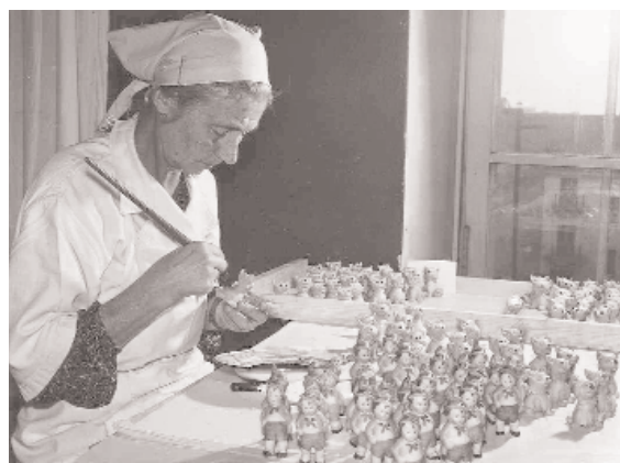
Archivbild aus der früheren Konditorei.

Die Kriegsjahre unterbrachen die Süßwarenproduktion, doch konnte Fazer mit Ersatzprodukten den Betrieb aufrechterhalten. Während des Zweiten Weltkrieges produzierte Fazer Makkaro-