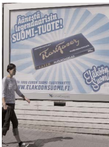
Berühmte blaue Schokolade.

Ab den 1990er Jahren kamen Unternehmen in Polen, Russland und Grossbritannien hinzu. Rund 60% aller Süswaren werden ausserhalb Finnlands abgesetzt.