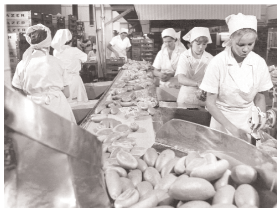
Archivbild von der Brötchenproduktion.