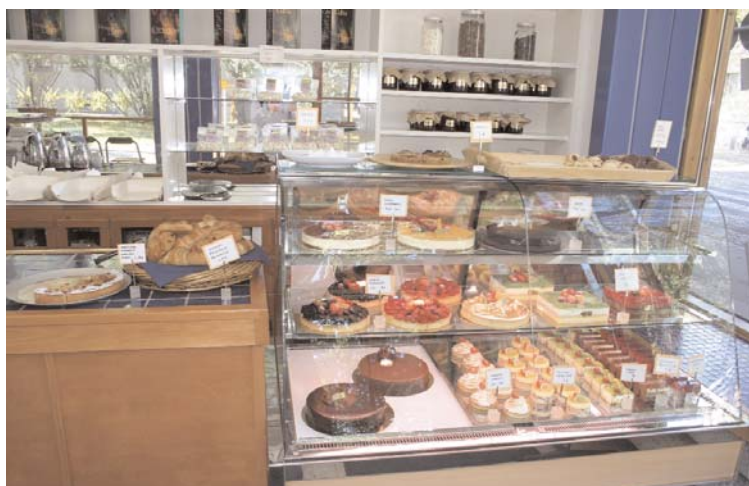
Anmüchelige Vitrinen im Konditorei-Café.

Die Fazer-Gruppe ist bis heute ein Familienunternehmen geblieben und operiert in den drei Geschäftsbereichen Catering (Fazer Food Services, mehrheitlich in Finnland und Schweden), Bäckereigeschäft (Fazer Bakeries, mehrheitlich in Finnland