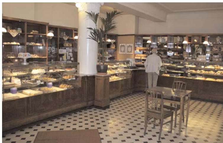
Blick in die seit 1891 bestehende Café-Konditorei Fazer in Helsinki.