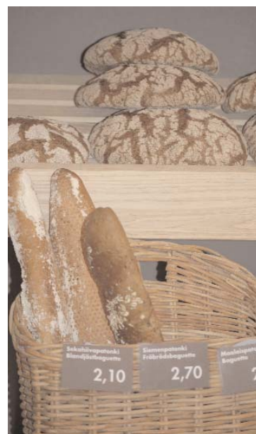
Brotgestell bei Fazer.

und Russland) sowie Süsigkeiten und Weingummi.