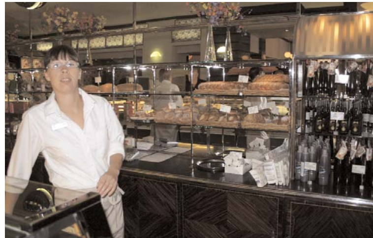
Der Fazer-Konzern beschäftigt heute 16 573 Mitarbeitende.

Aus dem kleinen Unternehmen ist in 120 Jahren eine Unternehmensgruppe mit 16573 Beschäftigten in acht Ländern und einem Jahresumsatz von 1,513 Milliarden Euro geworden. Bereits 1894 hatte Fazer mit der Fertigung von Schokoladetafeln und Konfekt begonnen, wofür die Konditorei bald zu klein war. Es wurde ein Gebäude erworben, in dem alsbald die industrielle Süßwarenproduktion in Finnland ihren Anfang nahm.