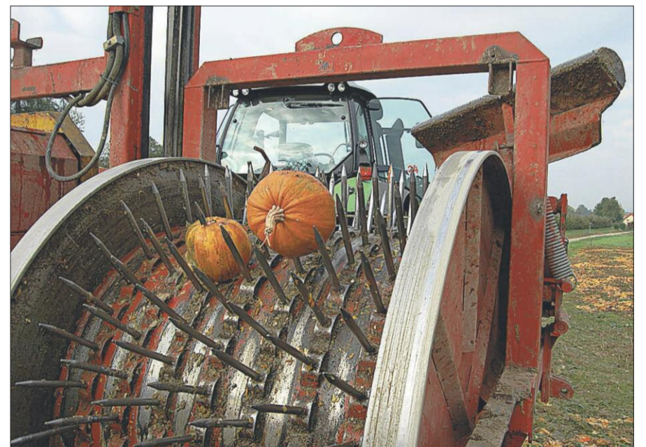
Der so genannte «Igel» der Erntemaschine sammelt die Kürbisse ein, danach werden in einer Trommel die Kerne vom Fruchtfleisch getrennt.