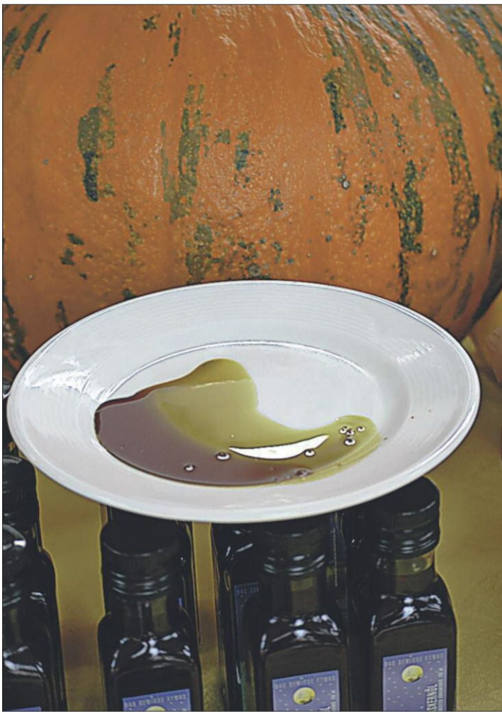
Öl, das aus Kürbiskernen gewonnen worden ist.