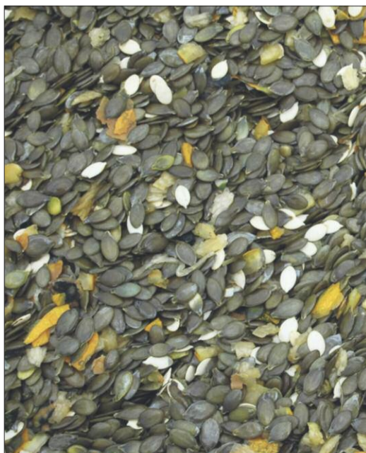
So präsentieren sich die Kürbiskerne, noch bevor sie gewaschen worden sind.