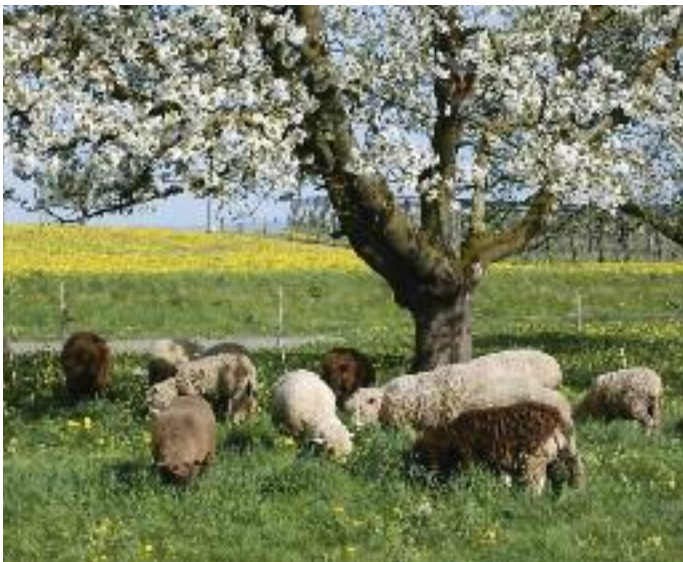
Der bäuerliche Alltag hat sich in Altnau trotz des Obstlehrpfades nicht verändert.