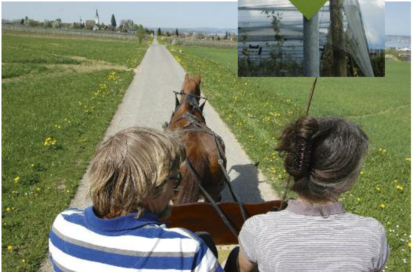
Zwei Anbieter von Kutschenfahrten laden ein, die Rundfahrt auf dem Obstlehrpfad mit Wagen und Ross zu erleben. Auch mit dem Fahrrad ist der 9 Kilometer lange Pfad angenehm, zu Fuss empfiehlt sich der Rundgang in Etappen zu machen.