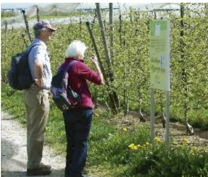
Insgesamt 16 Schautafeln liefern interessante Informationen rund um den Obstbau.

Natürlich fehlt auch ein Kapitel «Pflanzenschutz» nicht. Doch der «Wander-Lehrpfad» erzählt von Land und Leuten, Forst- und Landwirtschaft und informiert über Flora, Fauna und Geologie der Region. Er fordert die Wandernden zum Verweilen und Denken auf und bietet Informationen, die eigentlich zu unserem Allgemeinwissen gehören – nur eben in Vergessenheit geraten sind.