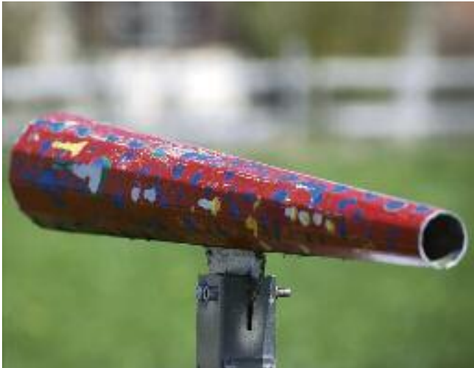
Solche «Fernrohre» gehören zur jetzt initiierten Erweiterung des Lehrpfades und laden zu einem ungewohnten Blick auf Obstbäume ein.