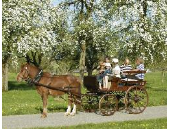
Besonders im Frühling ist es eine besondere Freude, die Landschaft entlang des Weges zu genießen.